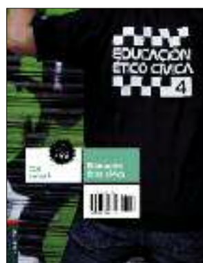
6 unidades / 96 páginas