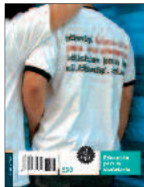
6 unidades / 96 páginas